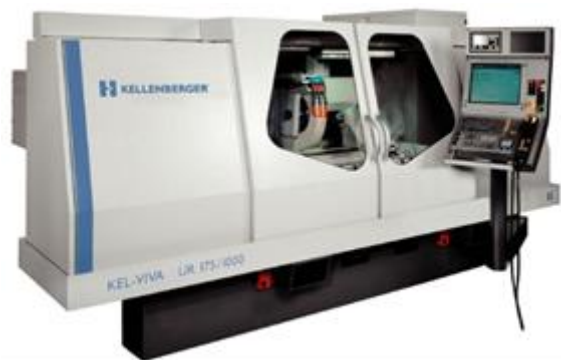
德国申克动平衡机