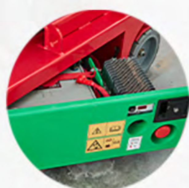
◎ 旋出托盘式电池仓