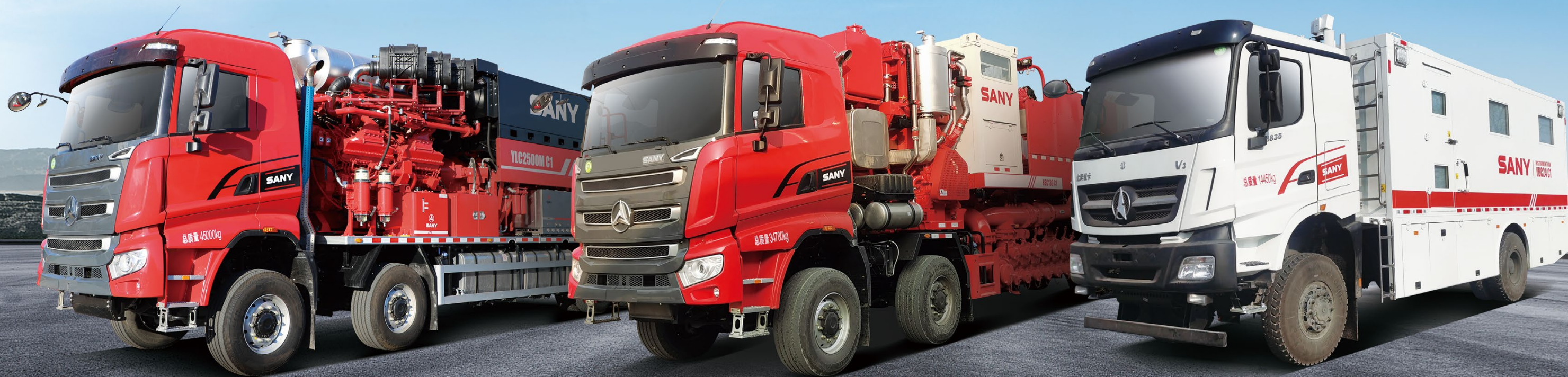
250型压裂车 YLC2500M CI