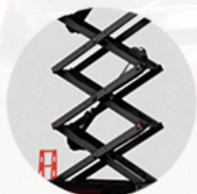
◎ 长寿命优质元器件