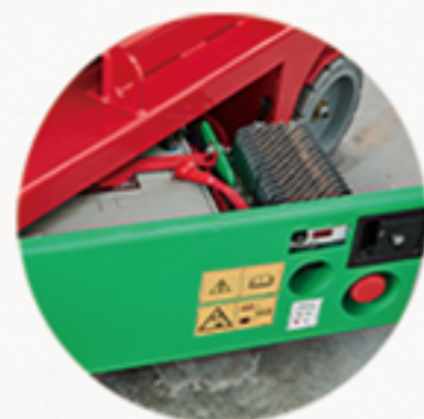
◎ 旋出托盘式电池仓